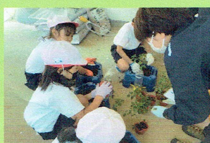
ミニトマトとサツマイモを植えました。