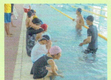
入水はゆっくりと!

これから海開きとなり海水浴シーズンが始まります。後日、「水泳の注意」についてのプリントを配布します。ルールを守って泳ぎましょう。