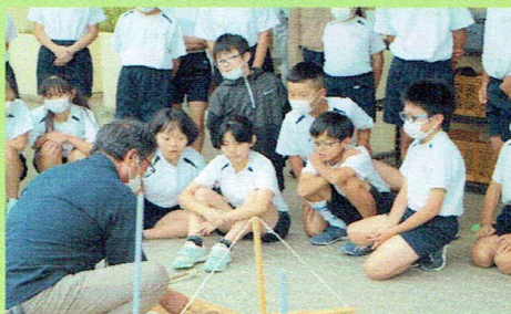
県の埋蔵文化財センターの方を講師に迎えました。