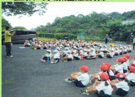
多賀中までの避難経路を確認しました。